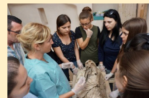
Studenti e docenti del corso STUDIO DELLE MUMMIE 2016 e 2017

PER ULTERIORI INFORMAZIONI VISITA IL SITO WWW.PALEOPATOLOGIA.IT