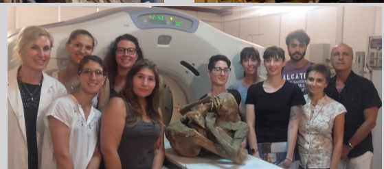
Studenti e docenti del corso 2016 e 2017

PER ULTERIORI INFORMAZIONI VISITA IL SITO WWW.PALEOPATOLOGIA.IT